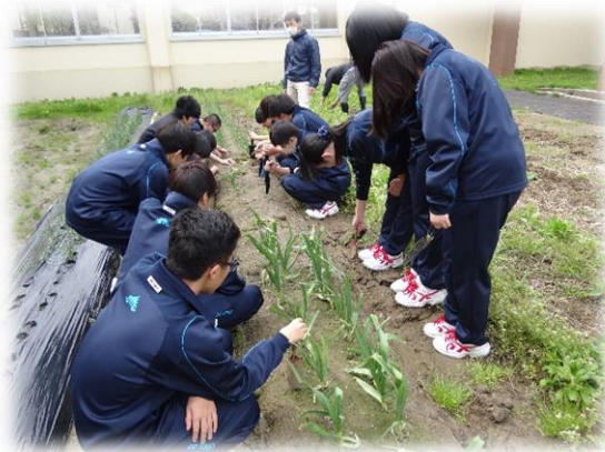
《農業と環境の様子》

教育目標の「自主・自律」を重んじ、各教科のバランスを考慮し、調和のとれた編成をしています。1年次は基礎となる必履修科目の国・数・英の科目を習熟度別クラス編成で行い、生徒が学習しやすいように配慮しています。2年次以降は就職や進学等の自分の進路希望に応じた自由選択科目を数多く選ぶことができます。また、演習科目を取り入れ、資格取得にも配慮したカリキュラムとなっています。