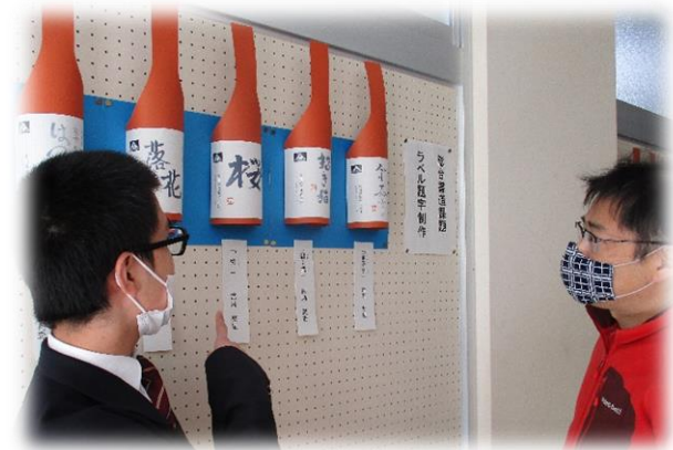
《総合書道の授業の様子》