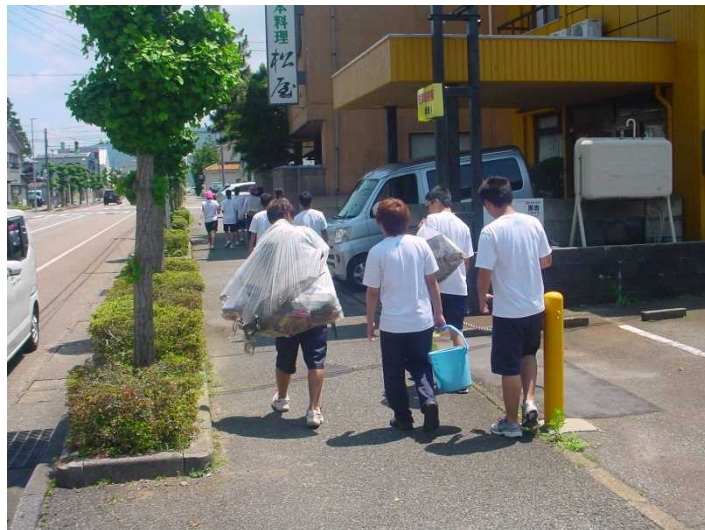
《全校生徒による地域美化活動の様子》