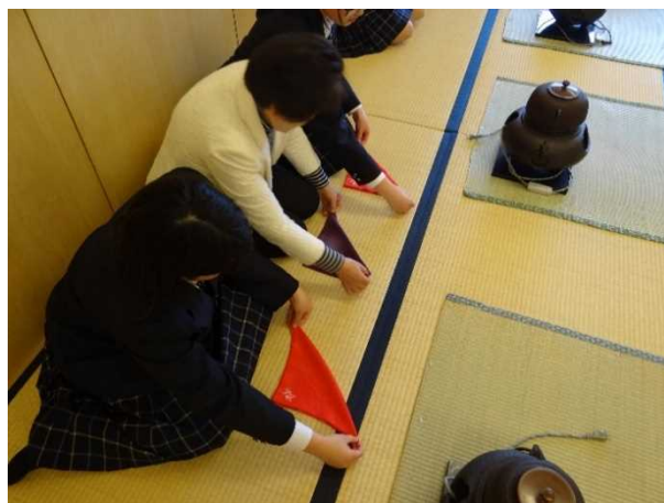
《茶道の授業の様子》